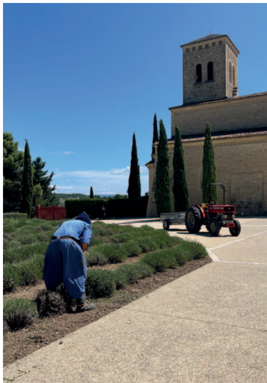
Männerabtei Abbaye Sainte-Madeleine; Mönch bei der Lavendelernte