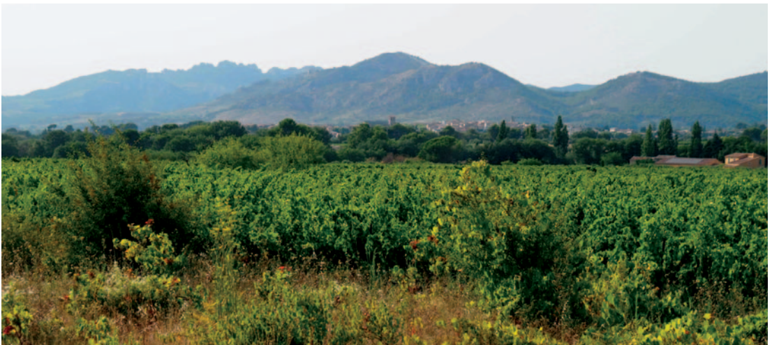
Weinfeld mit Blick auf die Dentelles de Montmirail

An der Orgel: Doyoung Ahn Johanneskirche