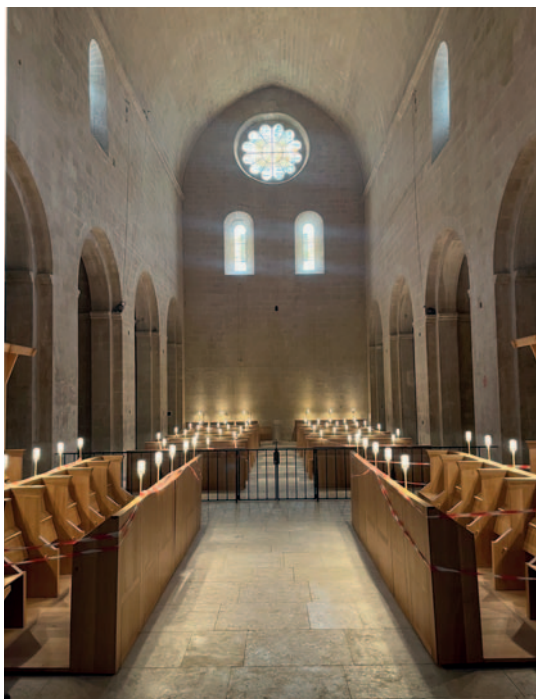
Das Weikulturerbe die Abtei Notre-Dame de Sénanque bei Gordes, Provence